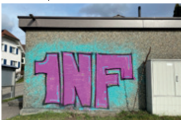
Mit Graffiti verschmierte Trafostation Sonnenhügel

In der Nacht vom Freitag, 18. Februar auf Samstag, 19. Februar 2022 hat eine unbekannte Täterschaft diverse Farbschmierereien in Tobel und Tägerschen angebracht. Der Sachschaden beläuft sich auf mehrere Hundert Franken. Es wurde Anzeige gegen Unbekannt eingereicht. Sollten Sie Beobachtungen gemacht haben, bitten wir Sie um entsprechenden Hinweis an die Gemeindeverwaltung Tobel, 058 346 01 00 oder an den zuständigen Polizeiposten Münchwilen, 058 345 28 30.