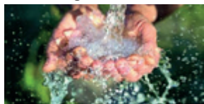
Auf zu neuen Energiequellen (Fastenkalender 2022)

Die Heilige Woche, Tod und Auferstehung Jesu. Dazu gehört auch Fasten und Almosen geben, Glaubensbekenntnis und Wallfahrt. Auf dem Fastentisch in der Kirche liegen die Unterlagen der Fastenaktion 2022 auf: Der traditionelle Fasten-Kalender und verschiedene weitere Texte. Ebenso das beliebte Jahresbuch „Gelassenheit“ mit 365 täglichen Kurzipulsen des Erfolgsautor Pfarrer Urs-Beat Fringeli. Nutzen Sie diese Möglichkeiten, um immer wieder neu und erneuert zu werden aus der Kraft des Religiösen, der Verbindung und Freundschaft mit dem Ewigen, mit Gott. - Alle Angaben auch direkt abrufbar auf Forum Kirche digital: https://regio-tobel.kath-tg.ch